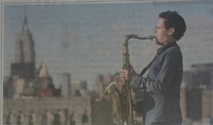
El francés Faiz Lamouri, el viernes 7 en el Solís

festival tendrá una fuerte dimensión académica. Además de los conciertos habrá clínicas gratuitas en la Zavala Muniz a cargo de los músicos del festival. Nathan y Bailly estarán el vier-